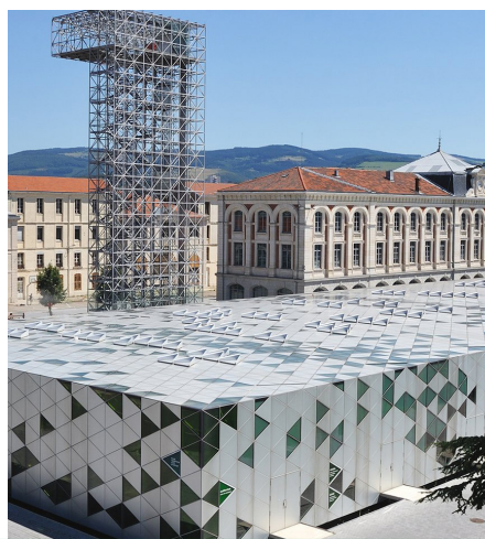
Cité du Design