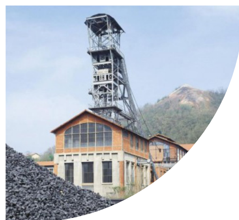
Musée de la Mine